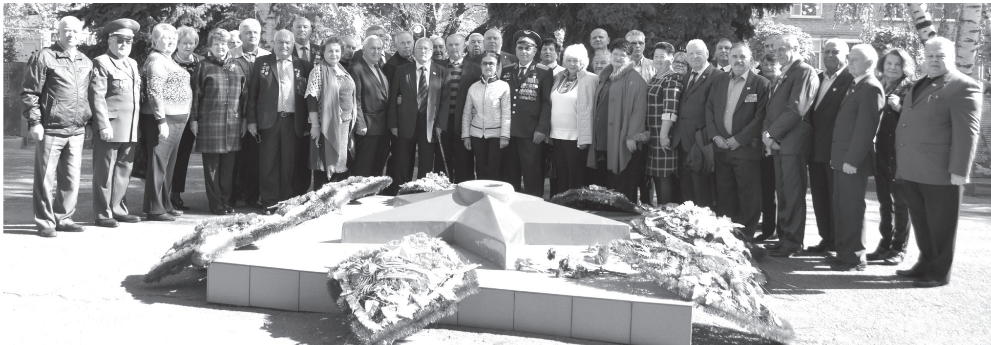
■ Добрая традиция — обмен опытом между представителями советов ветеранов Краснодарского края. Станица Анастасиевская, 2018 год.

Почти сорок лет назад, 30 октября 1979 года, в городе Славянске-на-Кубани был создан совет ветеранов. В настоящее время это Славянская районная общественная организация ветеранов (инвалидов, пенсионеров) войны, труда, Вооруженных Сил и правоохранительных органов. К сожалению, с нами уже нет тех, кто стоял у истоков её создания, но, самое главное, по-прежнему живы идеи основателей и неизменным остается девиз «Никто не забыт, ничто не забыто».