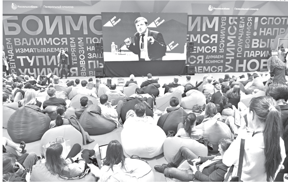
■ На площадках форума были организованы зоны прямого эфира, чтобы послушать полезную информацию мог любой желающий