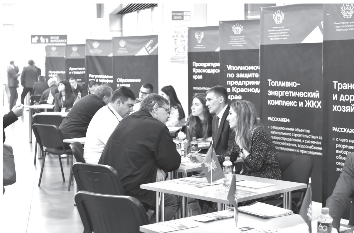
■ Каждый посетитель форума мог не только найти для себя лекцию по интересам, но и получить практическую консультацию

В дискуссии о конкурентоспособности легкой промышленности приняли участие представители Госдумы, Минпромторга РФ, краевой власти, эксперты от отраслевого бизнеса и фэшн-индустрии, представители торговых сетей и руководители предприятий легкой промышленности. Обсуждали самые актуальные вопросы развития отрасли: от подготовки кадров — до продвижения кубанских товаров