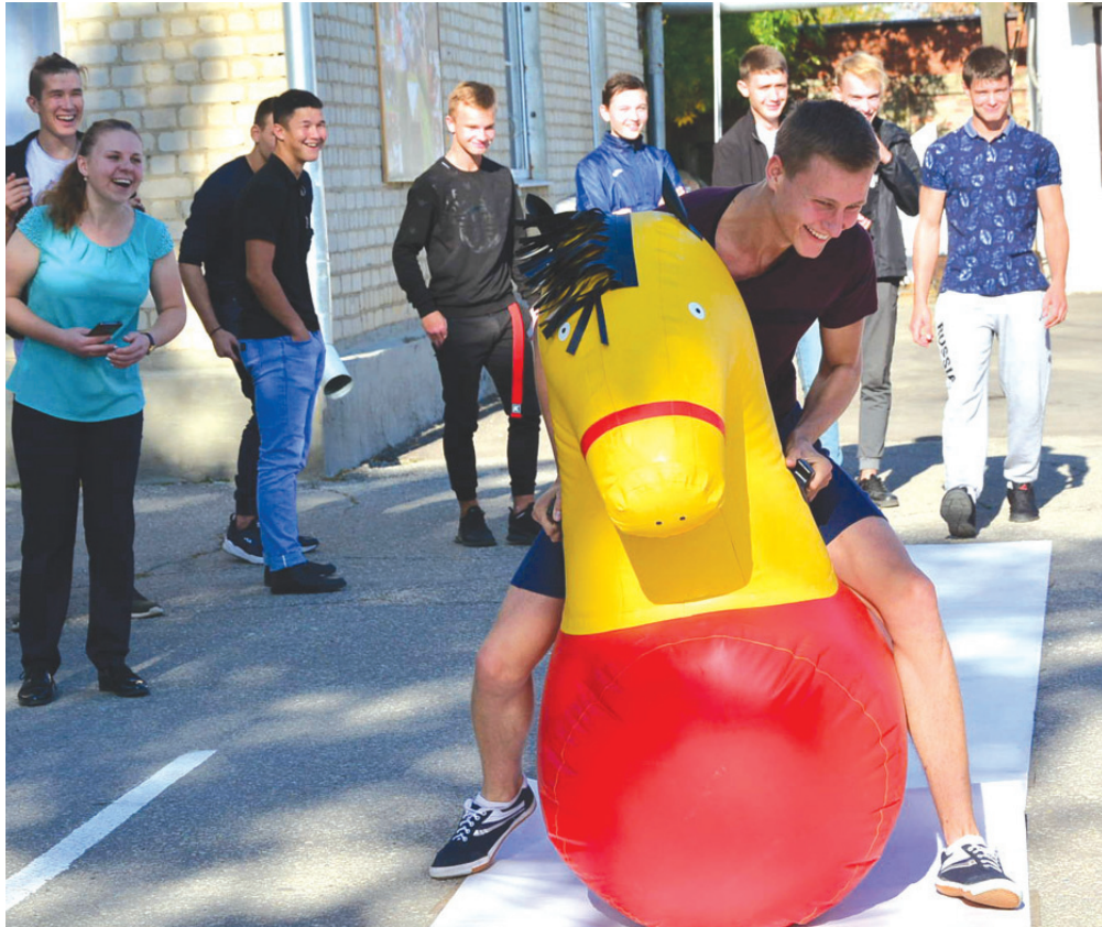
Вперед к здоровому образу жизни!

Весело и ярко в Славянском сельхозтехникуме прошло профилактическое мероприятие антинаркотической направленности «День здоровья».