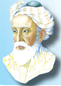
Омар Хайям, персидский философ, поэт.

Молчанье — щит от многих бед, а болтовня всегда во вред. Язык у человека мал, а сколько жизней он сломал!