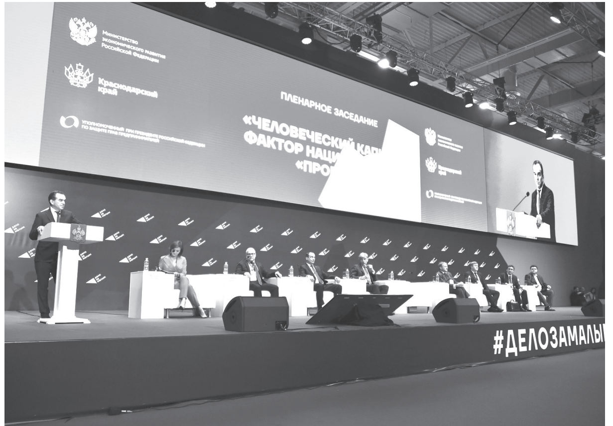
■ Развитие предпринимательства — стратегическая задача для экономики региона

Принял участие в форуме и известный предприниматель