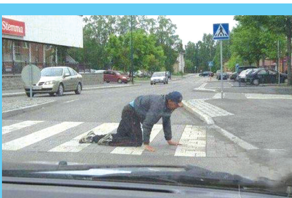
Алкоголь вредит коже... Особенно рук и ног.

Минздрав намерен продолжать принимать активное участие в государственной политике по сокращению вредного потребления алкоголя.