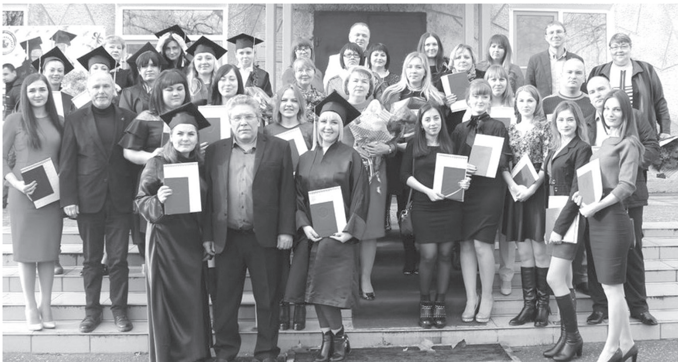
■ Выпускники 2019 года

Новым импульсом развития педагогического вуза в нашем городе стало присоединение СГПИ в качестве филиала к Кубанскому государственному университету в марте 2012 года. Мощный авторитет головного вуза не только в крае, но и в России, помогает филиалу успешно выполнять поставленные перед ним образовательные задачи и оставаться общепризнанным культурным, научным и спортивным центром юго-западной части края.