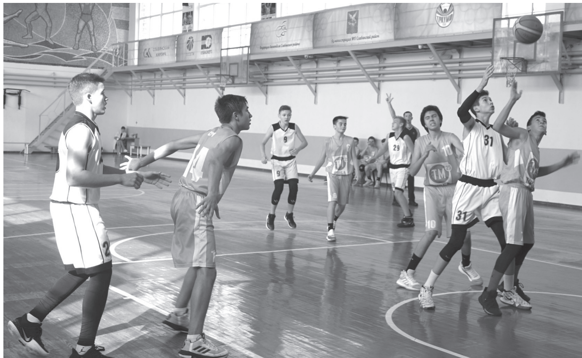
■ За победу в краевом первенстве сражаются сочинская и белореченская команды

Если сказать о первенстве, что это были интересные игры — значит, не сказать ничего. Они были захватывающими. Спорт-