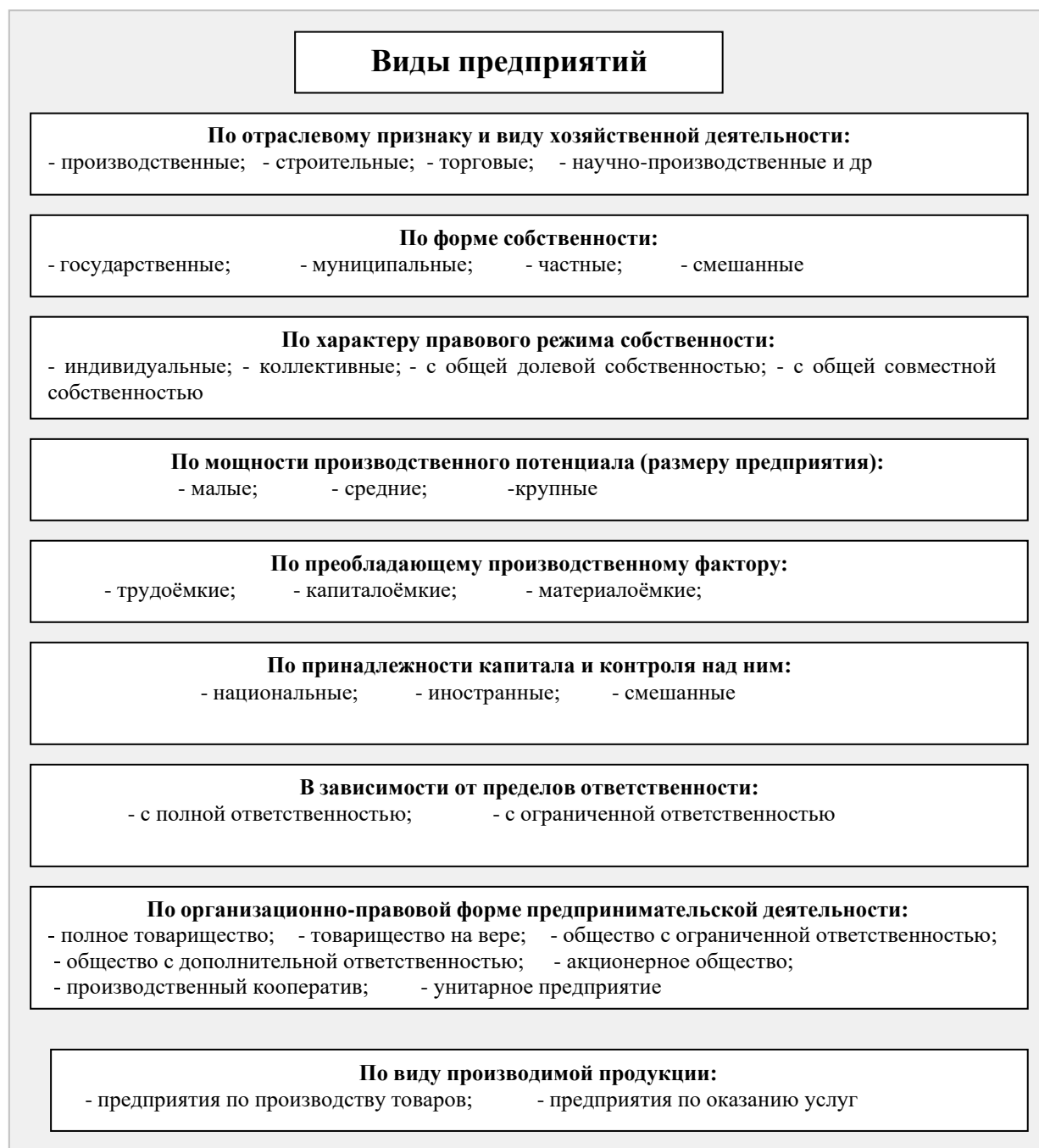
Рис. 1.2. Классификация предприятий.

собственности, числу собственников, организационно-правовым и организационно-экономическим формам и др. (рис.1.2.)