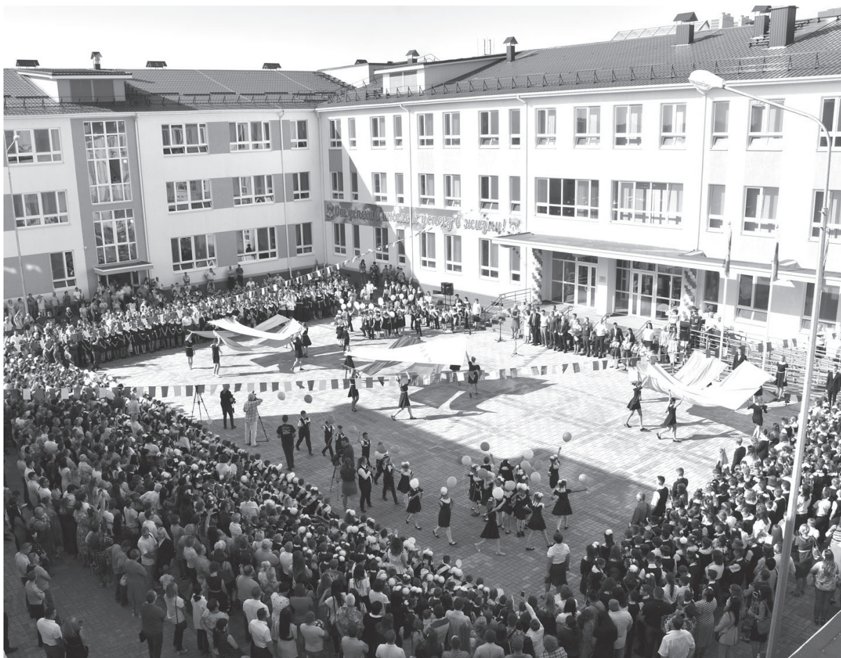
Школа № 12 в городе Славянске-на-Кубани