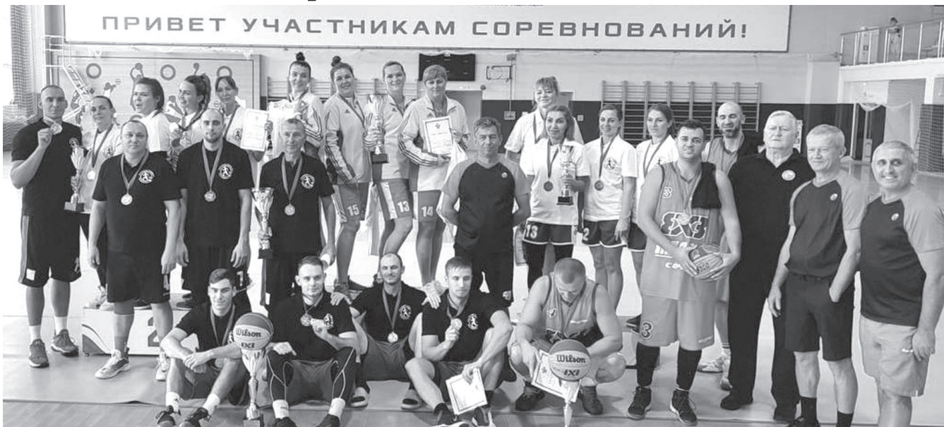
Участники первенства Краснодарского края по баскетболу

Славянские баскетболистки победили в финале первенства Краснодарского края по баскетболу 3х3.