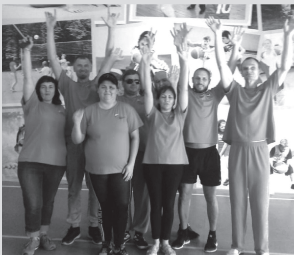
Славянская команда стала второй на краевом соревновании среди инвалидов по зрению

Команда Славянской местной организации Всероссийского общества слепых приняла участие в краевом спортивном конкурсе среди инвалидов по зрению «Современная мозаика». Соревнования велись по трем дисциплинам — общей физической подготовке, плаванию и комплексной эстафете.