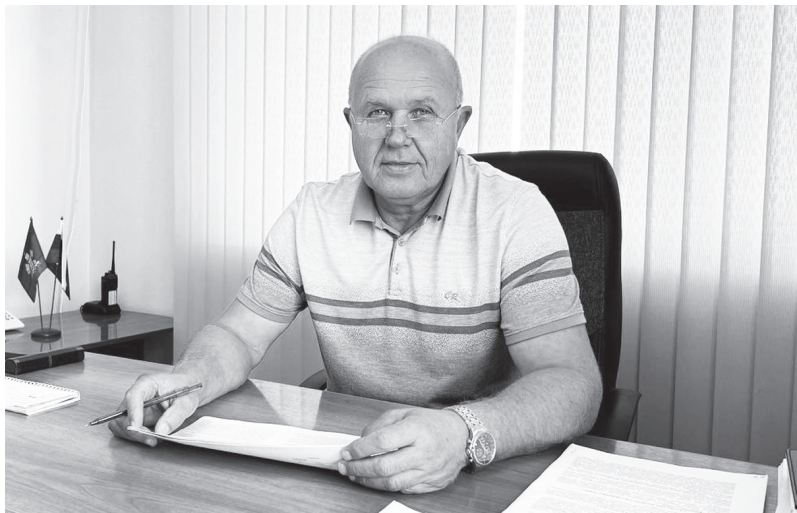
Глава поселения Александр Бельдиев