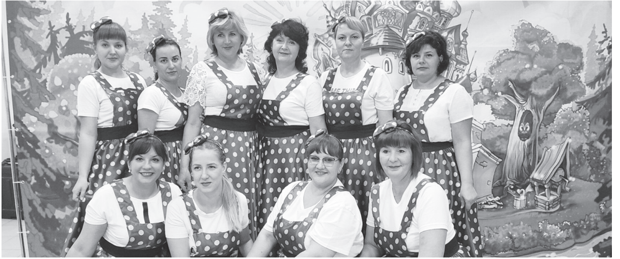
Танцевальный коллектив «Гармония» радует местных жителей своим творчеством