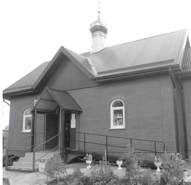
Крестильный храм — лишь часть строительства

Маленький храм, купол которого издали поблескивает сквозь ветки деревьев Северного парка, будто затаился за высоким забором напротив озера Толоки. Но двери его открыты, и он живет полноценной жизнью, каждую субботу и воскресенье встречая верных прихожан в своих по-домашнему уютных стенах. В нем уже совершаются богослужения и Таинства, а по церковным праздникам людей здесь особенно много. И сегодня, на Покров Пресвятой Богородицы, в храме прошло торжественное богослужение.