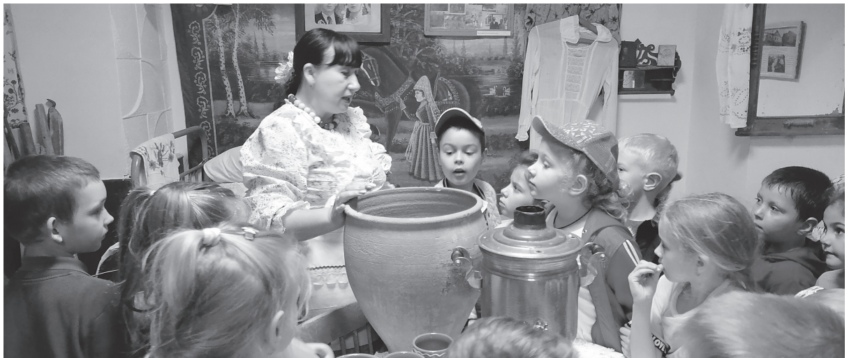
В 2001 году в Доме культуры хутора был открыт музей боевой славы и казачьего быта