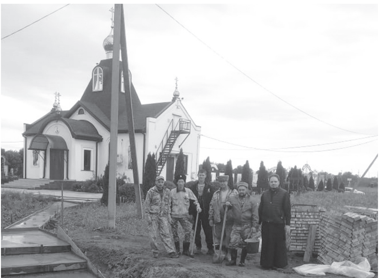
Завершен очередной этап строительства Крещенской купели на прихрамовой территории