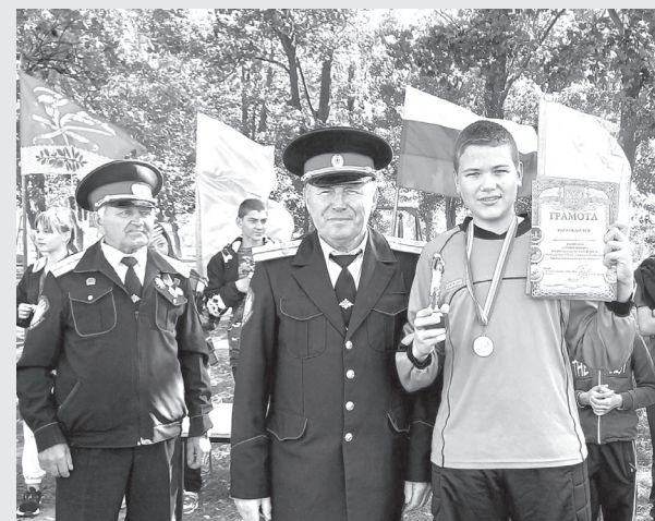
Казак Петровского поселения наградили лучших футболистов станицы

Пять футбольных команд школ станицы и команда школы №39 из хутора Галицын собрались на стадионе при СДК-1 «Петровский», чтобы побороться за переходящий Кубок атамана Петровского казачьего общества.