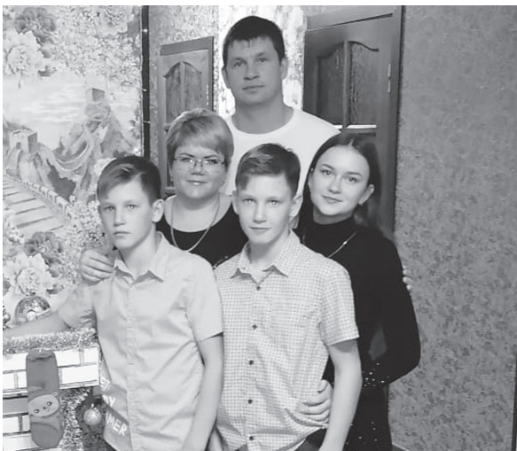
Семья Кондра любит проводить время вместе