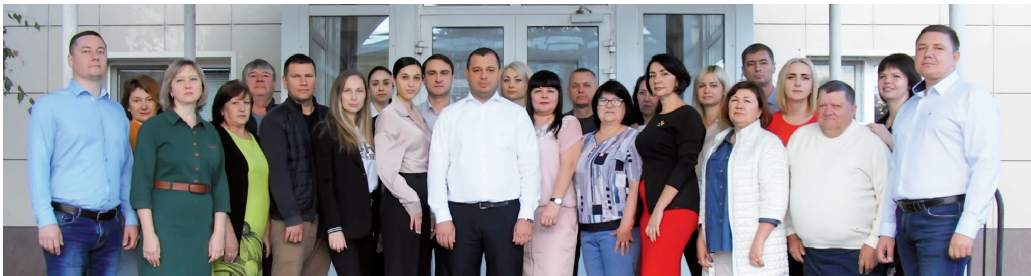
Коллектив администрации НАО «Славянское ДРСУ»