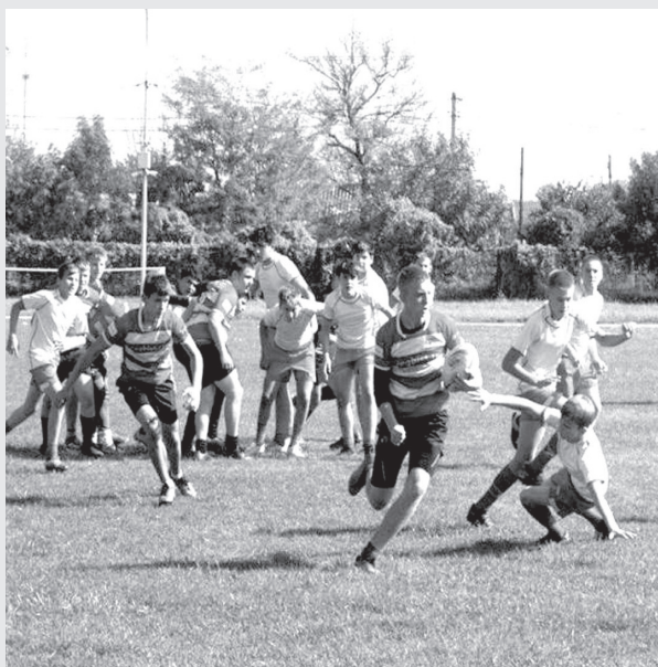
Славянские регбисты показали класс!

В минувшие выходные команда Славянского района по регби встретилась в честном бою со спортсменами из Красноармейского района.