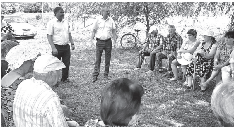
Встреча с жителями хутора Солодковского