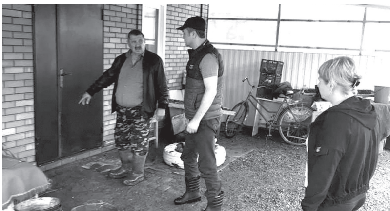
Выезд в станицу Петровскую во время ЧС