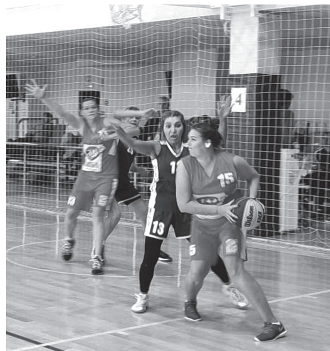
Славянским баскетболисткам нет равных в игре!

В спортивную школу им И.И.Имгрунта побороться за медали съехались 18 мужских и 19 женских команд из девятнадцати муниципальных образований Краснодарского края. По итогам состязаний женская сборная команда Славянского района заняла первое место! Мужчины оказались на 13-м.