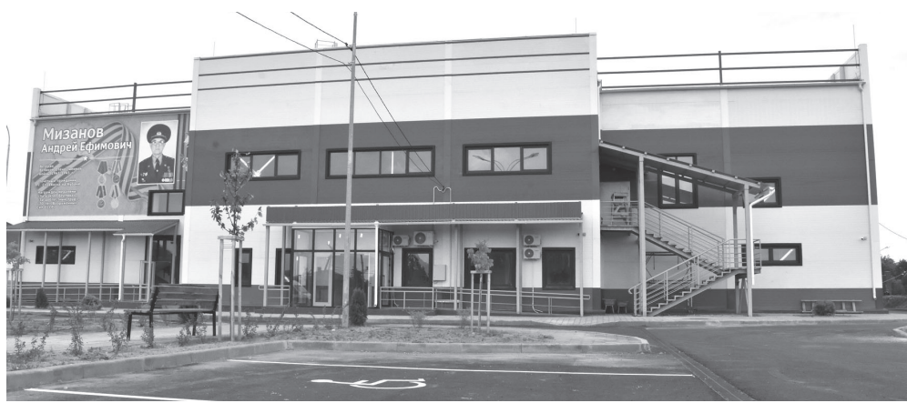
Центр единоборств «Медведь»