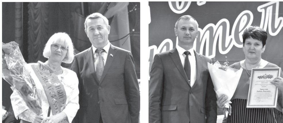
На торжественном мероприятии наградили лучших работников образования

12 школа удостоена чести хранить добрую традицию, основа которой была заложена год назад — 5 октября 2021 года. 24 клена увековечили имена пятнадцати педагогов-легенд и девяти почет-