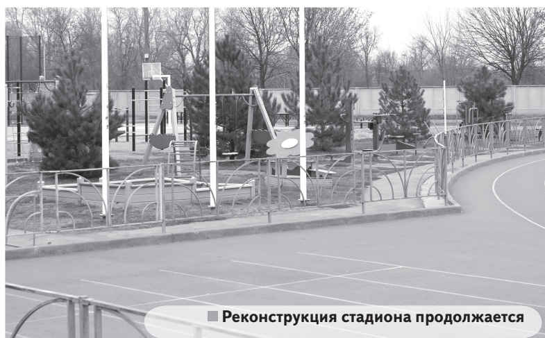
Реконструкция стадиона продолжается