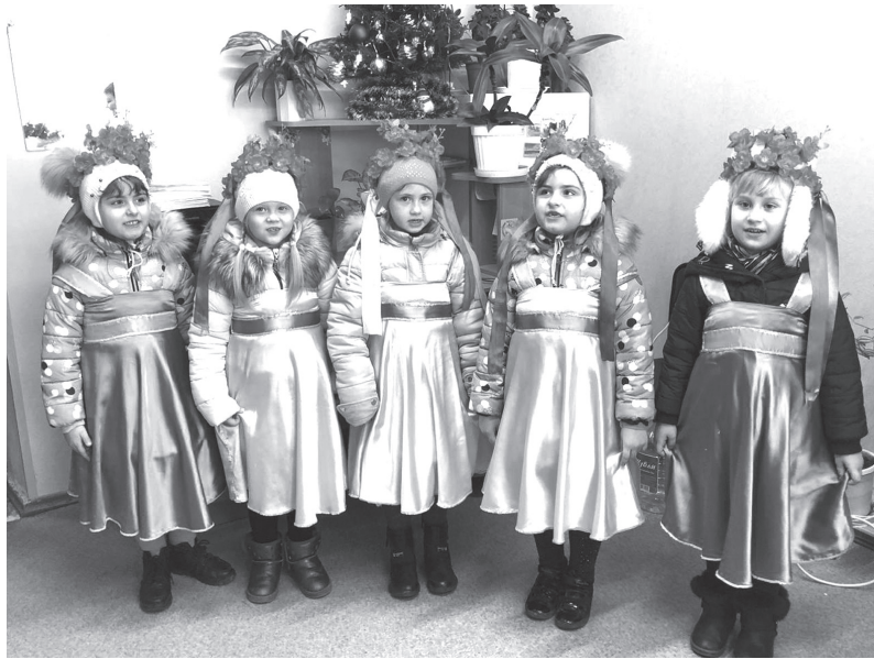
Малыши детского сада № 39 каждый год 14 января посевают, соблюдая традиции

В Протоцком поселении не только передают традиции из поколения в поколения, но и сохраняют память об историческом прошлом. Всего полтора года существует общественный клуб «Русич», участники которого люди «серебряного» возраста, но уже так много сделано! И в первую очередь это касается изучения