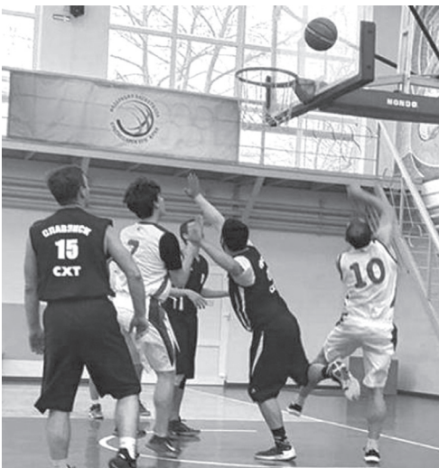
■ В напряженных играх баскетболисты показывали своё мастерство

В спортивном комплексе «Триумф» прошли игры третьего тура открытого чемпионата Славянского района по баскетболу среди мужских команд.