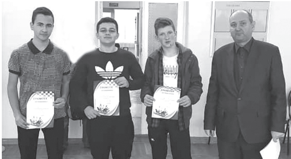
■ Лучшие шахматисты ДЮСШ «Белая ладья»

В детско-юношеской спортивной школе «Белая ладья» прошел блицтурнир по шахматам. В соревнованиях принимали участие 46 учащихся 2002 года рождения и младше.