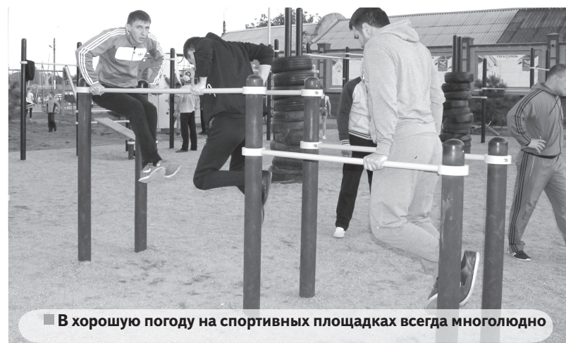
В хорошую погоду на спортивных площадках всегда многолюдно