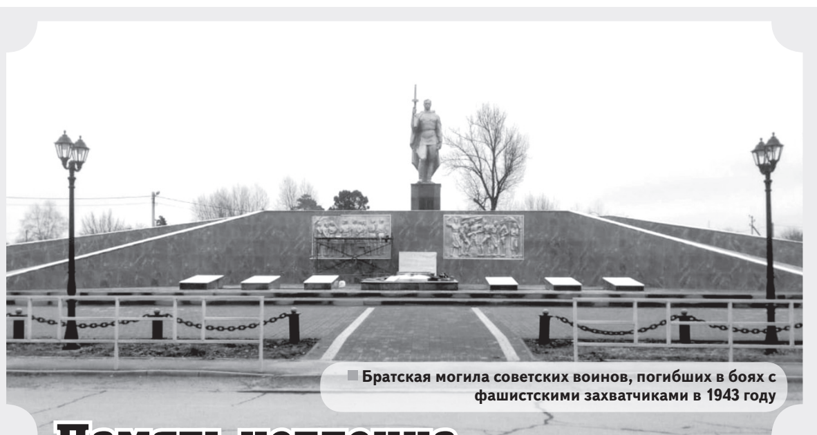
Братская могила советских воинов, погибших в боях с фашистскими захватчиками в 1943 году