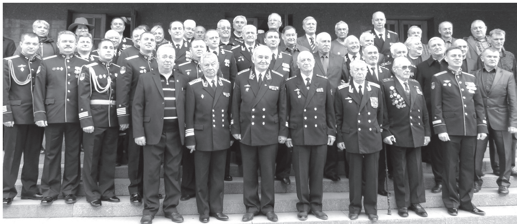
■ Управление боевой подготовки — элита Черноморского флота

А.Бойко