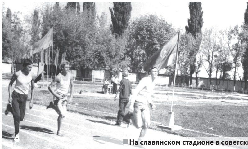
На славянском стадионе в советские времена.

В то время всё было исключительно на энтузиазме. Перво-