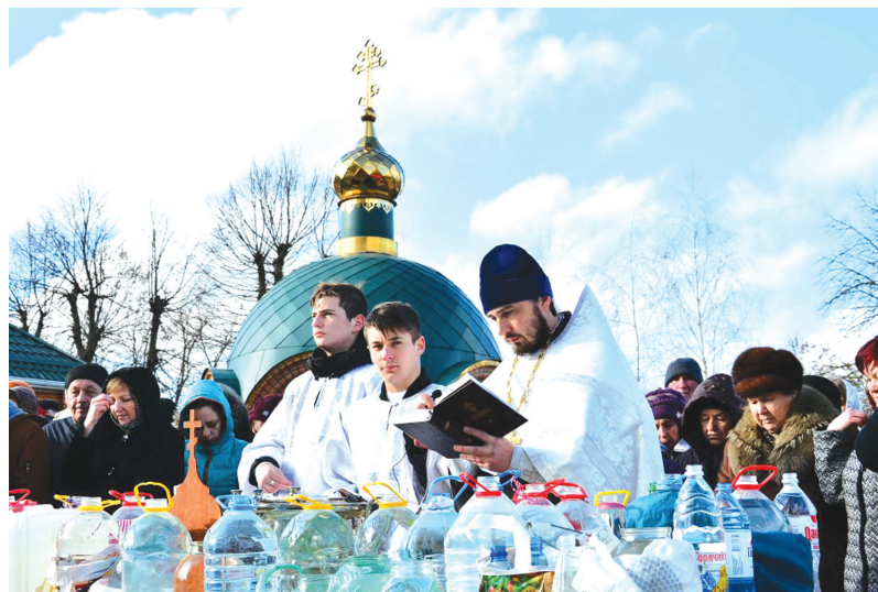
■ В день Крещения Господня проводится Великое освящение воды и по сложившейся традиции верующие троекратно окунаются в купель

— Самостоятельно, при помощи разума, друзей и близких человек может решить много проблем, кроме одной — спасения своей