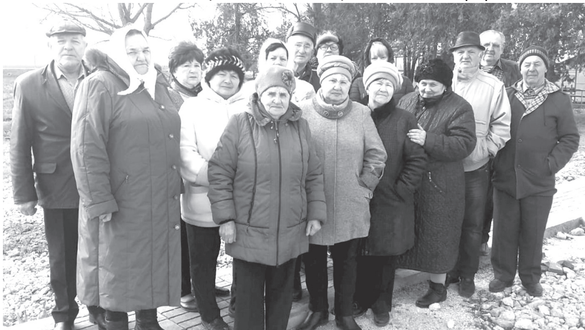
Участники клуба «Русич» проехали по местам боёв прорыва обороны «Голубой линии»

истории малой родины, родного поселения.