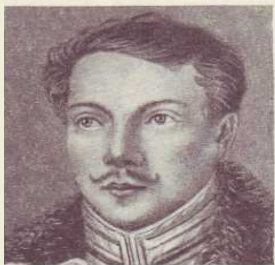
А. А. БЕСТУЖЕВ — МАРЛИНСКИЙ