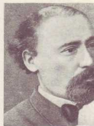
Н. А. НЕКРАСОВ