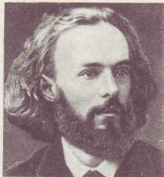
С. Я. НАДСОН