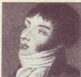
К. Н. БАТЮШКОВ