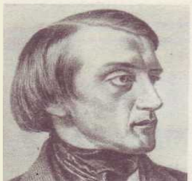
В. Г. БЕЛИНСКИЙ