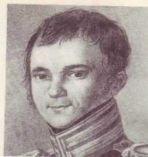
Ф. Н. ГЛИНКА