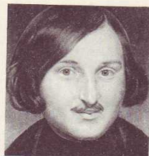
Н. В. ГОГОЛЬ