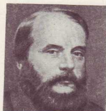
И. А. ГОНЧАРОВ