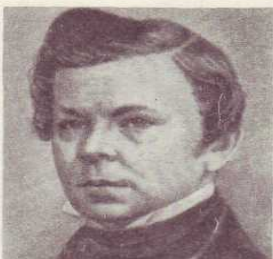
В. Г. БЕНЕДИКТОВ