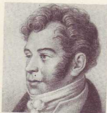
Н. И. ГНЕДИЧ