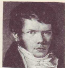
П. Я. ВЯЗЕМСКИЙ