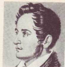
А. И. ГЕРЦЕН