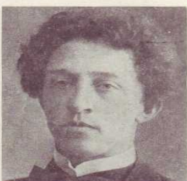
А. А. БЛОК