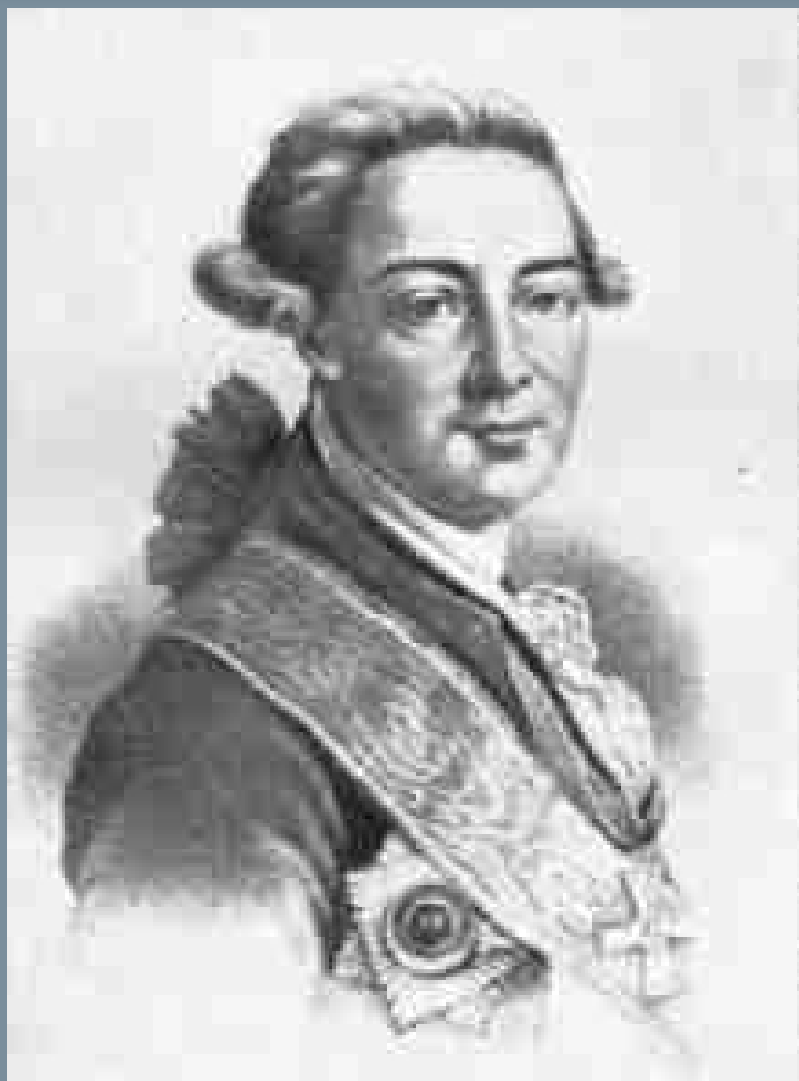
Херасков Михаил Матвеевич (1733 – 1807)