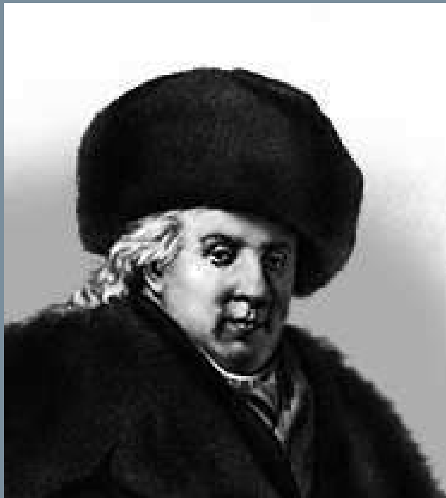
Державин Гавриил Романович (1743 -1816)