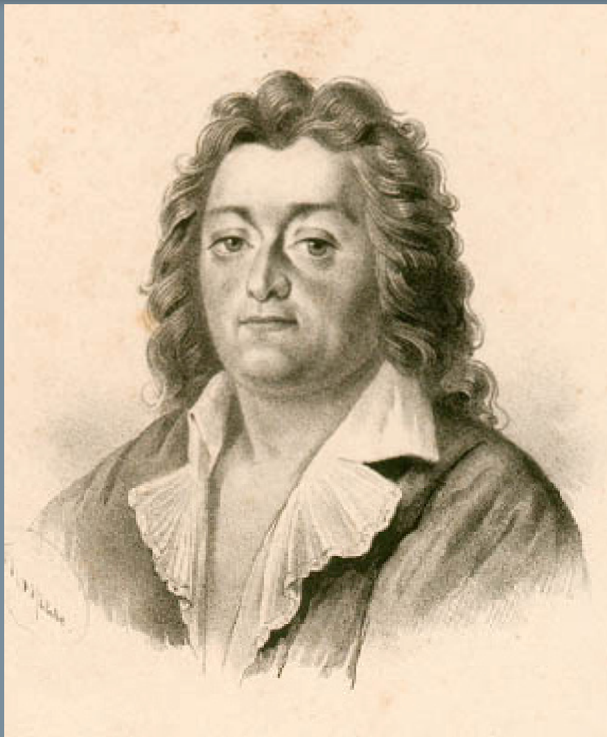
Плавильщиков Пётр Алексеевич (1760 -1812)